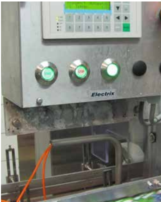
ANDECHSER MOLKEREI SCHEITZ